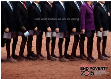
Anuncio Ganador "We are still Waiting" (Aún estamos esperando)

La Fundación Sophia de Palma de Mallorca y el Centro Regional de Naciones Unidas para Europa (UNRIC) difundirán, a través de una muestra itinerante de anuncios finalistas del concurso de Naciones Unidas, los Objetivos de Desarrollo del Milenio 2015.