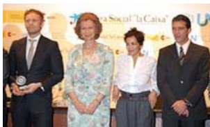
Entrega del premio por su Majestad la Reina Doña Sofía a Stefán Einarsson

En la víspera de la reunión plenaria convocada por el Secretario General de la ONU, Ban Ki-moon, que se llevará a cabo del 20 al 22 de septiembre en Nueva York, durante el sexagésimo período de sesiones de la Asamblea General de Naciones Unidas, con el objetivo de analizar las iniciativas que han demostrado tener éxito y que los gobiernos se comprometan a un programa de acciones concretas para los ODM.